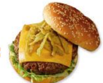
"CRISPY JALAPEÑO BURGER"