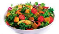
"ENSALADA CÉSAR PREMIUM"